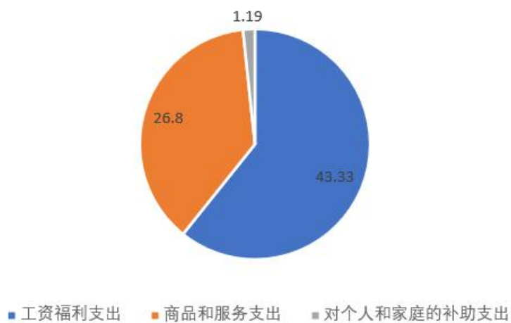
一般公共预算拨款支出情况