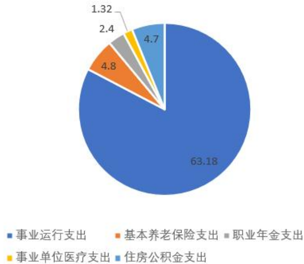
一般公共预算拨款支出情况